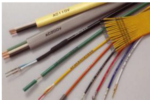
Kábel z PVC

Prístroje série B200 umožňujú jednoduchú a trvalú identifikáciu káblov, hadíc, plastových materiálov.