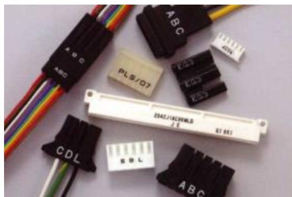
ploché PVC / plastové komponenty