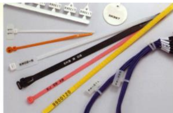
Šťahovacia páska (nylon)