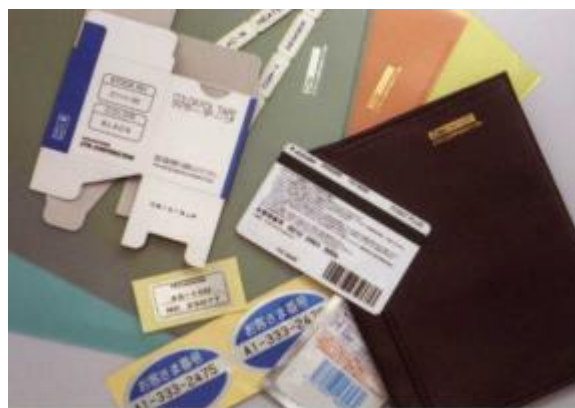
Plastové znaky, nápisy